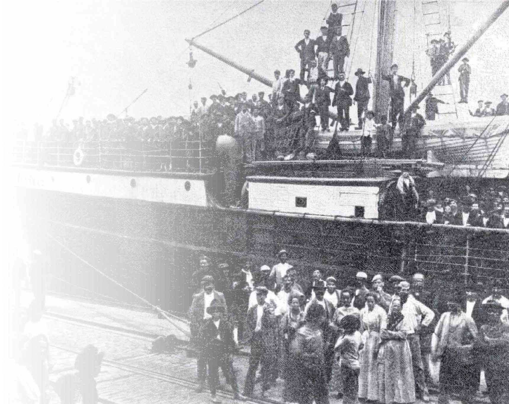
Desembarque de imigrantes no Porto de Santos (SP), 1907.